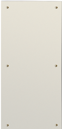
Größe 45 x 120 cm Leistung 850 Watt