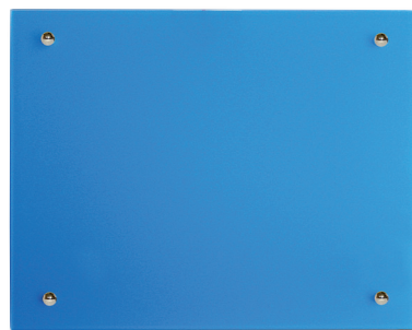
Größe 55 x 70 cm Leistung 500 Watt